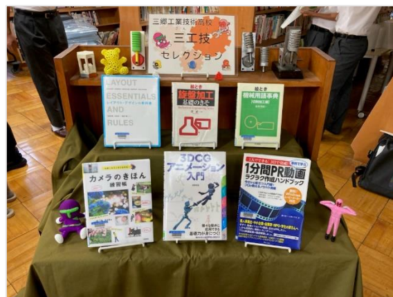
他校の展示の紹介を聞きました