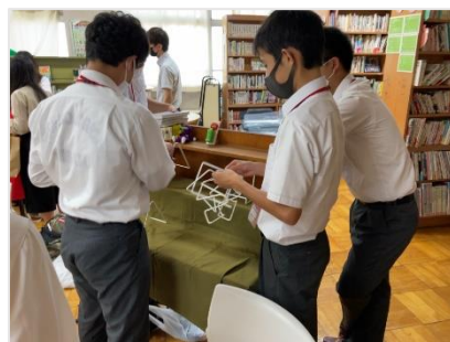
協力して展示を作成中！ 展示タイトル「三工技セクション」