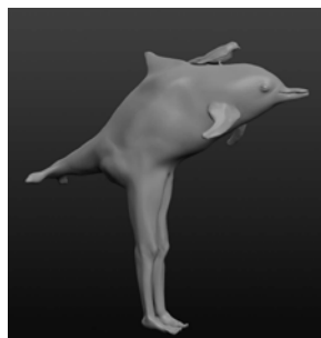
3年 歌川あすみ (和光・大和)